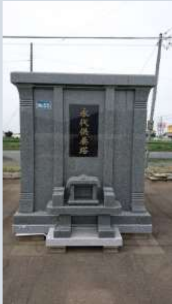
完成イメージ写真

法岩院墓地の中心に三界万霊塔という永代供養墓が建てられています。この度、塔の老朽化、環境整備の為、改修させて頂くことになりました。現在、年内完成を目指して計画しています。詳細が決定しましたら、再度通知させて頂きます。